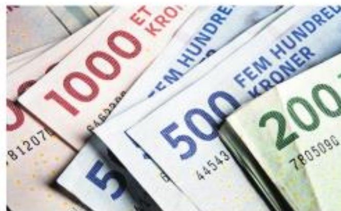
Politikerne må finde flere penge til folkeskolen. Ellers går det galt, mener formand for lærere og ledere.

- De penge, skolerne får tilført, bruges på drift, og når der kommer færre penge, må vi spare på vores drift. Det kan være, at vi hele tiden afskaffer muligheden for at komme på skoleferier. På nogle skoler er der måske stadig ledende. De kan også forsvinde, siger Christian Maers-